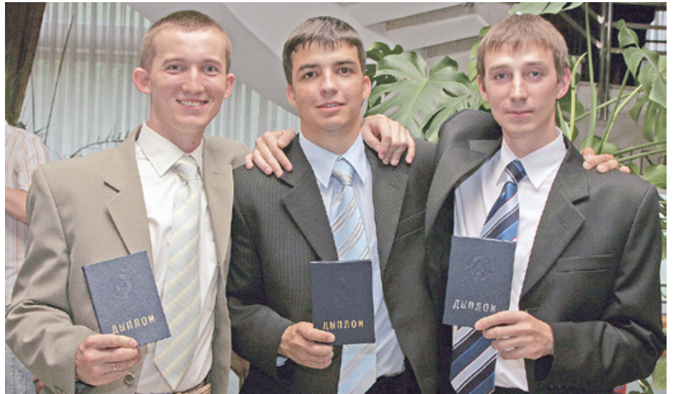
Выпускники академии – дипломированные специалисты