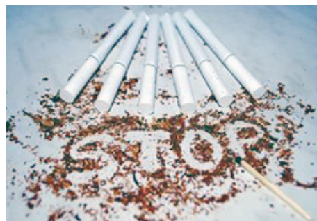
По материалам Пресс-центра

К участию приглашаются студенты всех курсов Академии управления. Ждем ваши работы на электронный адрес Студенческого совета Института управленческих кадров: academystudsovet@gmail.com .